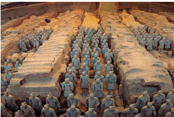
Guerreiros de Terracota =Xian