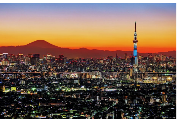
Tokyo Sky Tree Tower e Mt. Fuji