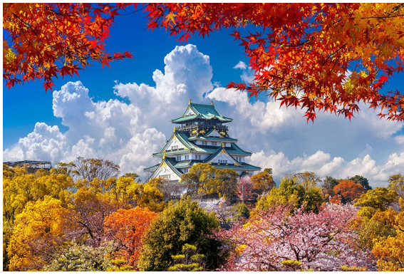
Castelo de Osaka