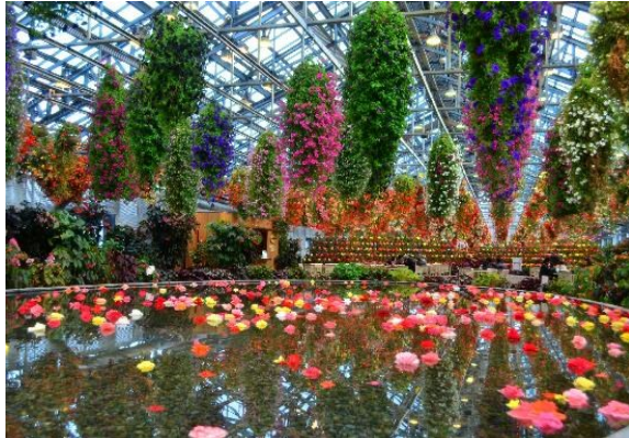
Nabana No Sato