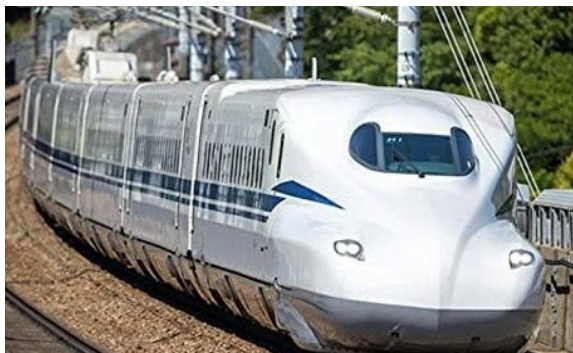
Trem bala Shinkansen