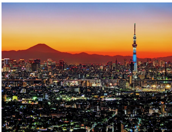
Tokyo Sky Tree Tower e Mt. Fuji