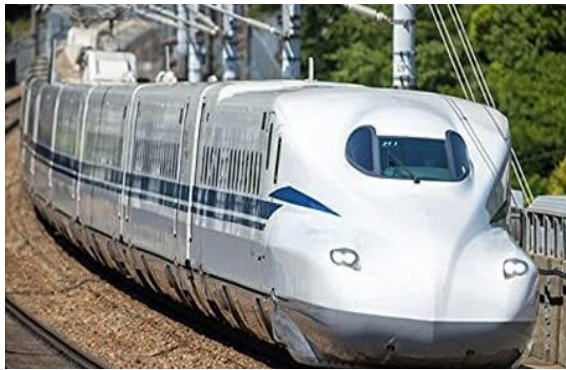
Trem bala Shinkansen