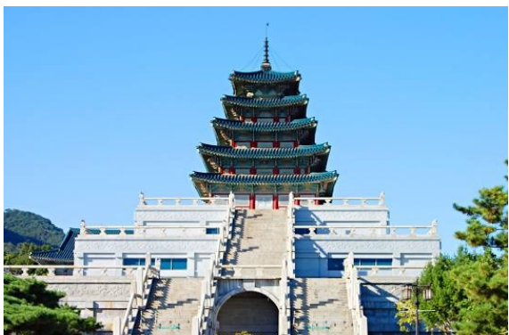
National Folclore Museum

A Korea milenar com a sua rica história e atualmente um dos países mais tecnológicos! e o Japão também com a sua tradicional cultura, seus antigos castelos e santuários seculares, por onde caminharam os samurais. E a natureza exuberante, com picos nevados, florestas, riachos, paisagens multicoloridas como uma gravura!