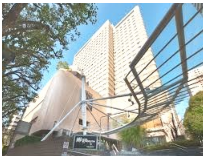
Hotel Metropolitan Ikebukuro

Está localizado próximo da Estação Ferroviária de Ikebukuro, oferecendo ligações de transportes fáceis: 5 linhas ferroviárias e 3 linhas de metro, incluindo acesso direto às áreas de Shinjuku, Harajuku e Shibuya. O hotel dispõe de um spa, de 6 restaurantes e de quartos com acesso gratuito à Internet, Wi-Fi com vista panorâmica da cidade. Cada quarto inclui banheiras, comodidades para preparar chá. O hotel também dispõe de um salão de estética. Restaurantes do hotel incluem culinária japonesa, chinesa e europeia. O restaurante italiano Est, no 25º andar, e o bar Ovest oferecem vistas espetaculares da cidade. O restaurante Cross Dine serve um buffet internacional.