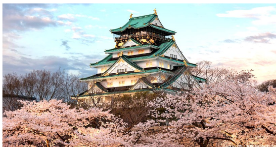
Castelo de Osaka