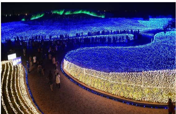
Milhões de leds de Nabana no Sato