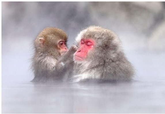
Yudhanaka monkeys Park

www.alpen-route.com/en/about/introduction.html (Temp. 3C. a - 4C. )