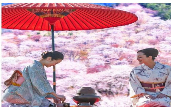
Cerimonia do chá