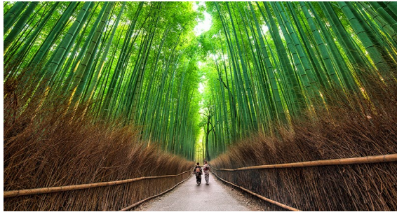
Bosque de Bambu em Arashiyama

CAFÉ DA MANHÃ. 08H10 - ENCONTRO COM O GUIA E TRASLADO A ESTAÇÃO DE TOKYO. 09H21: EMBARQUE NO TREM BALA SHINKANSEN, CHEGANDO 11H32 EM KYOTO. RECEPÇÃO POR GUIA FALANDO ESPANHOL E EXCURSÃO A NARA, PRIMEIRA CAPITAL DA NAÇÃO, DE 710 A 784, CONHECERÃO O TEMPLO TODAJI COM O SEU IMENSO BUDA DE BRONZE, O PARQUE NARA. NO RETORNO, VISITAREMOS O TEMPLO FUSHIMI INARI, CONHECIDO COMO O TEMPLO DE 1.000 TORII. ACOMODAÇÃO NO KYOTO TOKYU HOTEL. WWW.TOKYUHOTELSJAPAN.COM/GLOBAL/KYOTO-H/GUIDE/