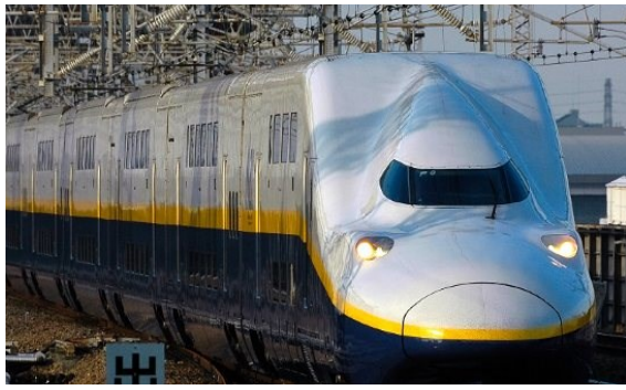
Trem bala Shinkansen