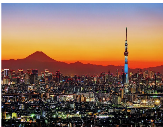
Tokyo Skytree e Mt. Fuji